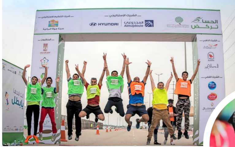
مشاركات من كل الأعمار ومن كل الشرائح في ظاهرة رائعة