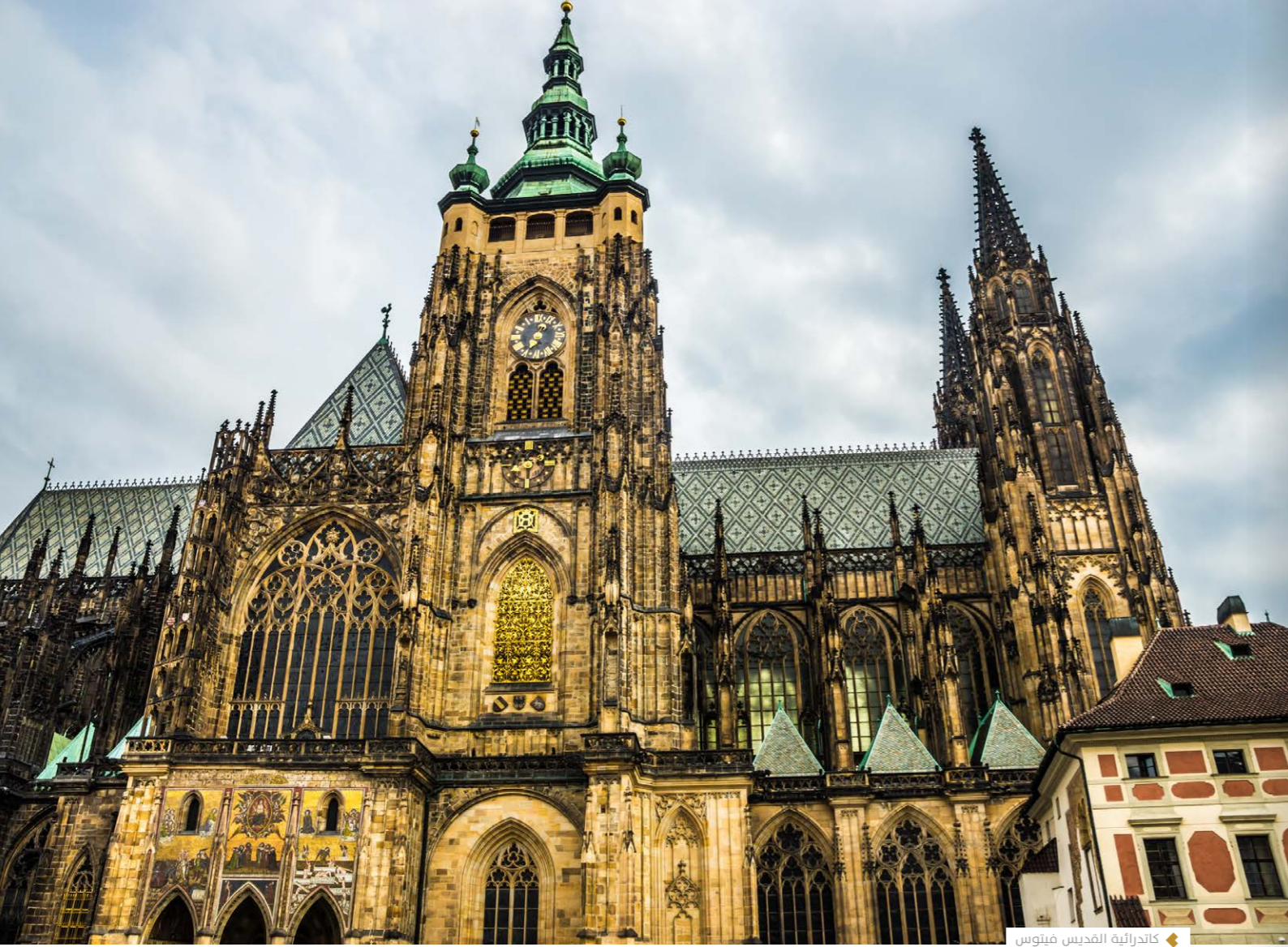
كاتدرائية القديس فيتوس

يبلغ عدد سكان المدينة حوالي المليون ونصف المليون نسمة على مساحة 500 كم 2 . كل كيلو متر مربع فيها يحكي حكاية تاريخية وفيه معلم أثري وسياحي. تلك المدينة التي تتمشى بين أروقة التاريخ والتي باتت مقصداً للمسرحيين والتسكيلييين والممثلين والموسيقيين لممارسة إبداعهم في متحف مفتوح على العالم.