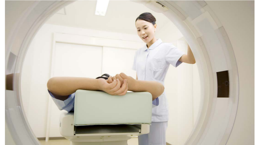
بالجودة وحدها وبالتركيز عليها قبل كل شيء، آخر تحقق الإنتاجية

وحلفائها منتصرين، توجهات جديدة نحو تكثيف وطرح السلع والخدمات. في المقابل كانت اليابان بلداً مهزومة مدقمة تسعى إلى استعادة قوتها بالوسائل السلمية عن طريق الصناعة والتجارة، لتبدأ في عام 1950م تطبيق استراتيجية قائمة على تقديم التشجيع الكبير والحوافز المغرية للشركات الأمريكية، بغية جذبها للاستثمار، وهو ما صاحبه هجرة عدد كبير من رواد الإدارة الأمريكيين إلى اليابان؛ لاسيما المفكرين الذين مازالوا متمسكين بمبادئ الإدارة العملية وتأكيدا على ضرورة الجودة وإتقان العمل، لينطلق مفهوم الجودة وتطبيقاتها في المجالات المختلفة وفي كافة المؤسسات.