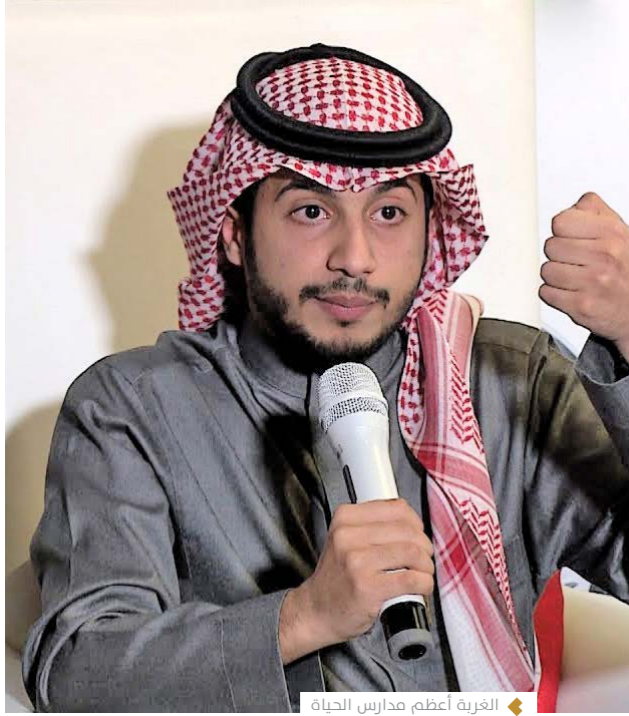
الغربة أعظم مدارس الحياة