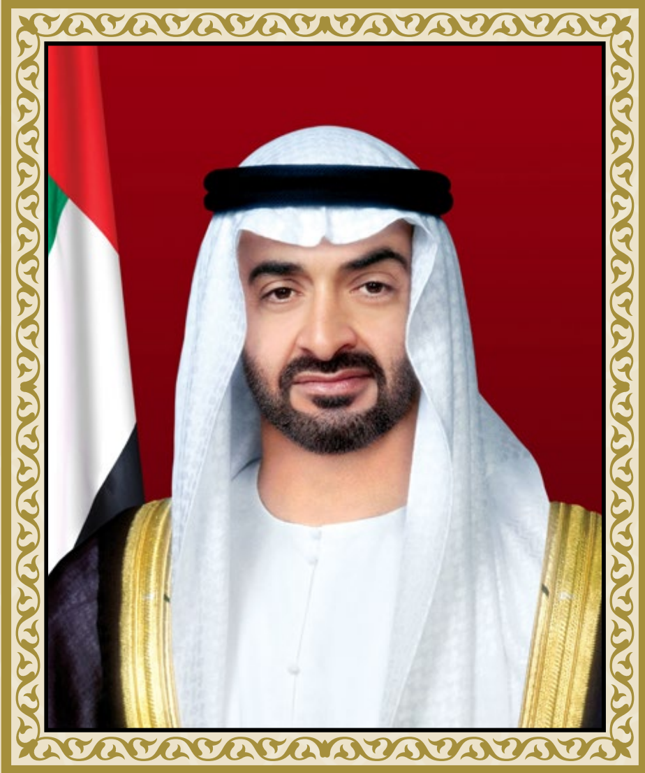
صاحب السمو الشيخ محمد بن زايد آل نهيان ولي عهد أبوظبي نائب القائد الأعلى للقوات المسلحة