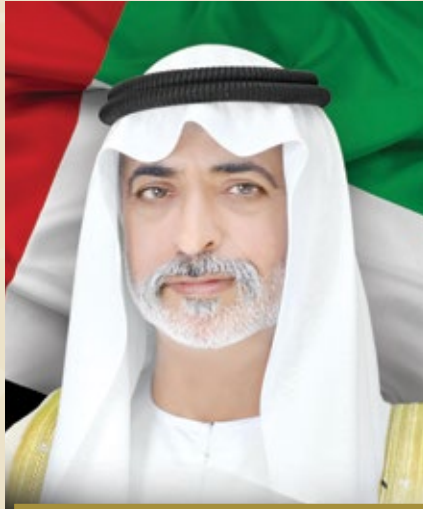
معالي الشيخ نهيان بن مبارك آل نهيان