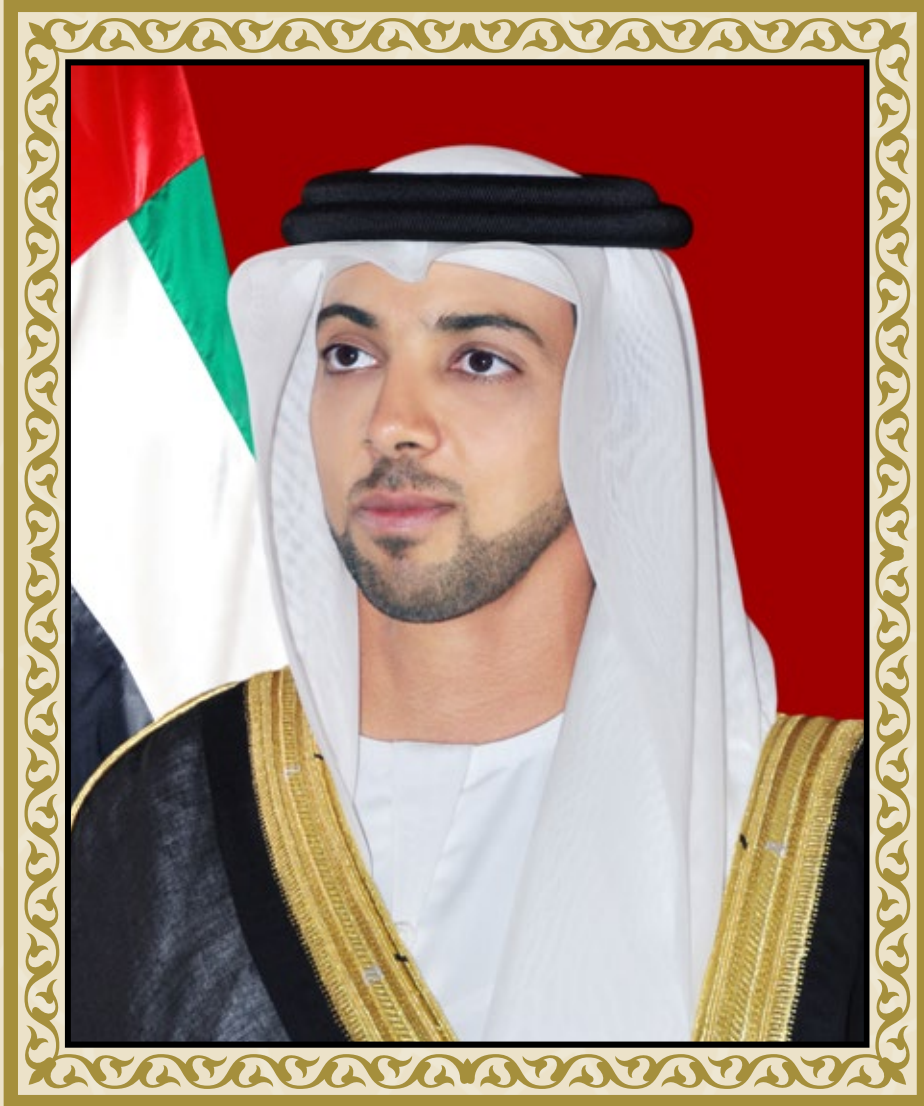
سمو الشيخ منصور بن زايد آل نهيان نائب رئيس مجلس الوزراء - وزير شؤون الرئاسة