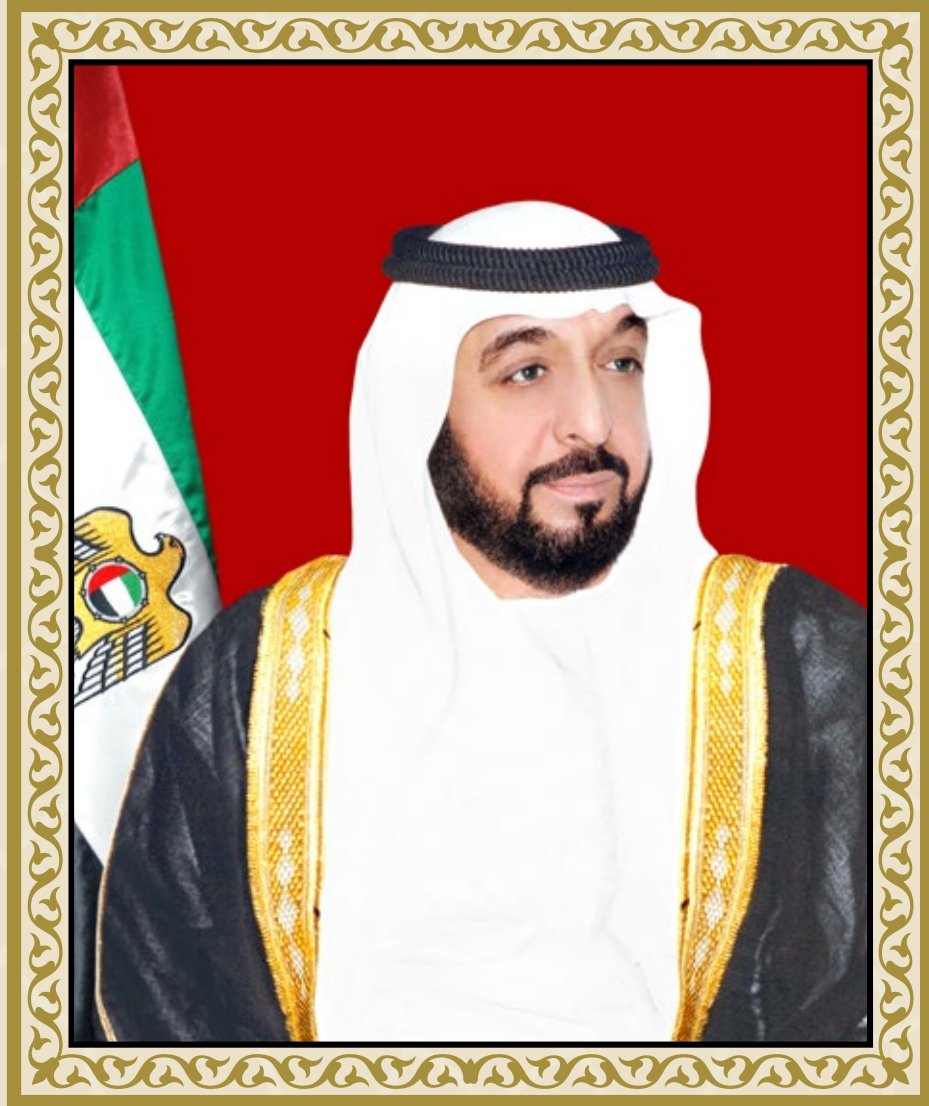
صاحب السمو الشيخ خليفة بن زايد آل نهيان رئيس دولة الإمارات العربية المتحدة - حفظه الله